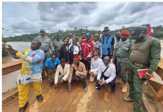
Photo souvenir sur le pont de Kikot, le 25 octobre 2023

Plus haut sur la crête qui surplombe Mbebe, la vue est totale sur la Sanaga. Quasiment tout le monde se trompe sur le véritable emplacement du barrage à construire, l'envisageant plutôt en amont du pont. Les explications de l'équipe KHPC clarifient le repère, ce sera plutôt en aval. De même, la zone inondée est précisée aux participants. En chemin retour, le groupe a fait une halte sur l'île.